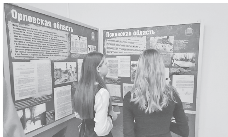
Экспозиция вызвала интерес